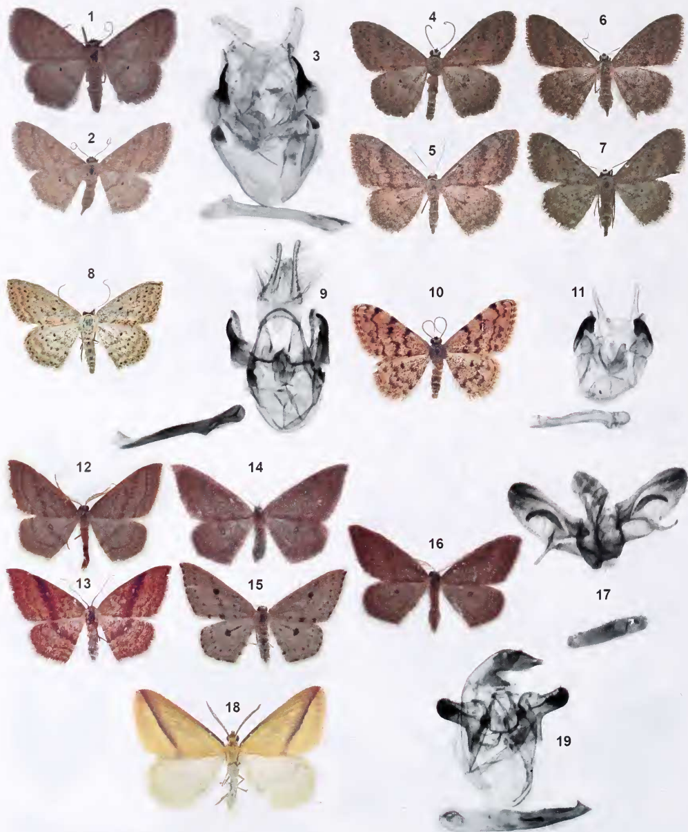
Lámina III.- 1. S. minorata (♂) Las Palmas, GC, V-1958; 2. S. minorata (♀) Los Sauces, LP, III-1963; 3. Andropigio de S. minorata ; 4. S. guancharia guancharia (♂) Güimar, TF, III-1961; 5. S. guancharia ilustris (♀) Los Sauces, LP, I-1962 (paratipo); 6. S. guancharia mus (♀) Valverde, EH, XI-1963 (paratipo); 7. S. guancharia uniformis (♀) Telde, GC, XI-1958 (paratipo); 8. S. guancharia uniformis (♂) Arrecife, LZ, XI-1972; 9. Andropigio de S. guancharia ; 10. G. asellaria (♂) Bco. del Infierno, TF, III-1971; 11. Andropigio de G. asellaria ; 12. C. maderensis (♂) Las Mercedes, TF, III-1962; 13. C. maderensis (♀) Las Mercedes, TF, III-1962; 14. C. maderensis (♀) Los Sauces, LP, X-1963; 15. C. maderensis (♀) Los Sauces, LP, X-1963; 16. C. maderensis (♂) Valverde, EH, IX-1963; 17. Andropigio de C. maderensis ; 18. R. sacraia (♂) Los Sauces, LP, XI-1962; 19. Andropigio de R. sacraia .